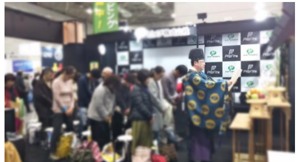
【ランナーのご祈祷】