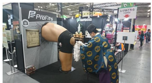
【お清めされているビッグニーくん】