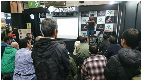
【テーピングセミナー】

当日は、2日間で約600名の方へランニングに適したテーピングの貼り方をレクチャーしました。また、「プロ・フィッツ」のシンボルオブジェ「ビッグニーくん」にはお清めが行われ、ランナーの方々は、「ビッグニーくん」の大きさに驚きながらも、一緒に写真を撮るなどして賑わいを見せました。イベント終了後には、ランナーの想いが込められたミニ絵馬が護王神社にてお祓いされました。