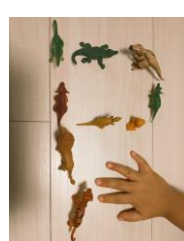
＜“消えた「P」を探せキャンペーン”応募作品＞