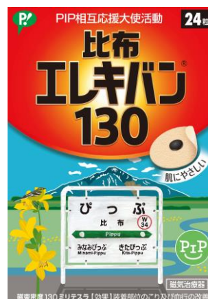
【「風っこ そうや」号デザインのピップエレキバン】

北海道比布町とピップ株式会社は今後もお互いの魅力を相互にPRすべく、様々な活動を実施予定です。 「PIP相互応援大使活動」の最新情報は、ピップ株式会社のHPや、比布町及びピップエレキバン・ピップマグネルーブの公式Twitterにて公開予定ですので、ぜひチェックしてみてください！