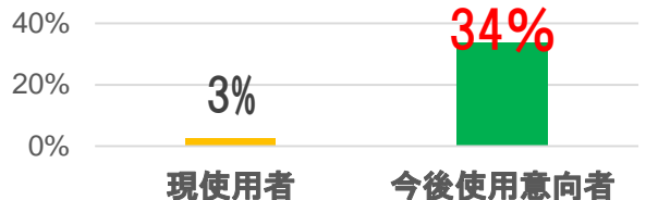
<図1> 圧迫固定サポーター使用実態