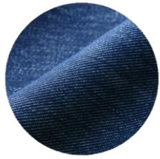
【デニム風ネイビー】